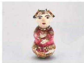
モチーフその1 パンブタオ